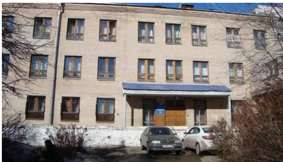
Второй корпус общежития