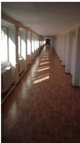
Переход из одного корпуса в другой