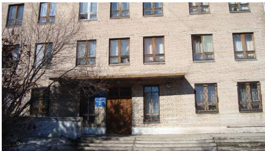
Первый корпус общежития

Студенческий городок «Солнечный» (общежитие) Магнитогорской государственной консерватории (академии) имени М.И. Глинки, рассчитан на 150 мест, предназначен для размещения иногородних студентов, аспирантов, слушателей подготовительных курсов и слушателей курсов повышения квалификации на период обучения. Иностранные граждане, принятые на обучение по межгосударственным соглашениям (контрактам), размещаются в общежитии на общих основаниях с российскими студентами и аспирантами, обучающимися в данном учебном заведении.