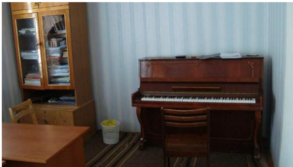
Класс для индивидуальных занятий

Жилые комнаты общежития рассчитаны на 1 и 2 проживающих. Комнаты оборудованы необходимой мебелью: кроватями, столами, стульями, встроенными и плательными шкафами.