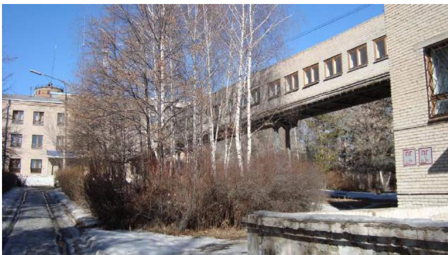
Переход из одного корпуса в другой